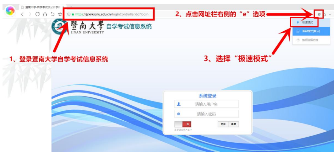
图 1 浏览器极速模式

1、下载 360 极速浏览器或 QQ 浏览器，登录暨南大学自学考试信息系统（ https://jyxyks.jnu.edu.cn/ ），在网址栏右侧找到“e”的选项，点击后在下拉菜单中选择“极速模式”。（注意：必须先完成此步骤才能正常打印准考证）