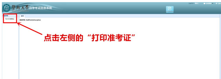
图 5 选择打印准考证