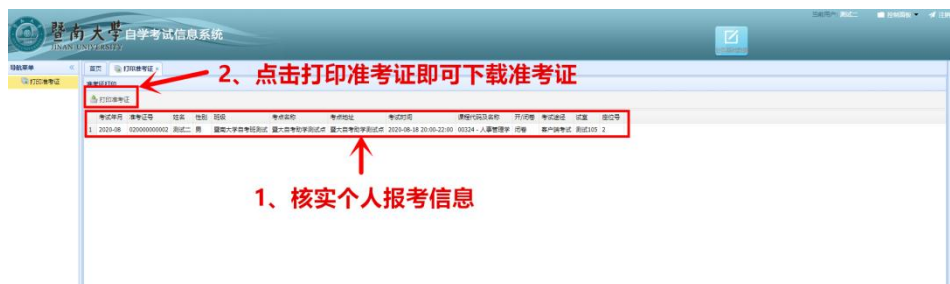
图 3 下载准考证