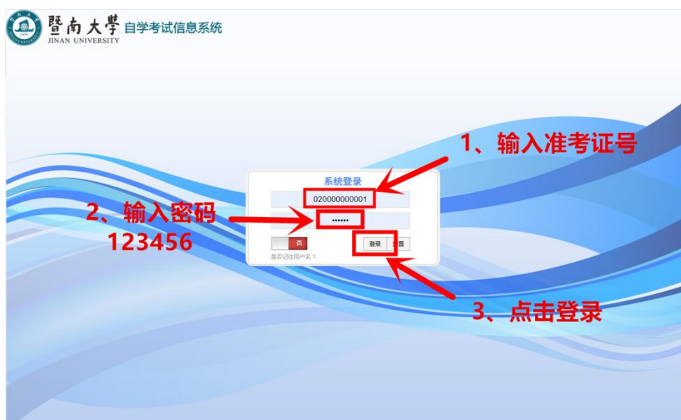
图 2 暨南大学自学考试信息系统